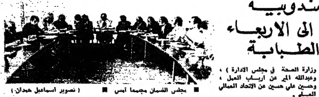
مجلس الضمان يسي مندوبيه الى مؤتمر حيف.. ويرجى الى الاربعا البحث بتعديل تعرفات الطبابة

زارت البعثة المشتركة لفرقة التجارة العربية - الفرنسية، والفرقة الفرنسية - اللبنانية، برئاسة السيد عدنان القصار رئيس فرقة بيروت قبل ظهر امس وزير المال السيد فريد زويول. وقد اطلع الوزير زويول البعثة على مساهمة الحكومة المالية التي تقوم على تسجيع التجارة العربية ومركز على الحرية المنظمة والمطورة وعلى تأمين التسويقات والحوافز الثقيلة بلين المشاركة بين القطاع الخاص اللبناني والقطاعات الخاصة الأجنبية. واكد الوزير زويول نحيب الحكومة باللبنانيين الاجانب التي زارت وتزور لبنان، ولا سيما البعثة المشتركة الفرنسية، وقال ان هذه الزيارات هي دليل بحد من هذه البعثات باستمرار الاوضاع في لبنان وفتح ملف الاجتار. واضاف: ان الحكومة اللبنانية لن تلتزم جدياً في تقديم كل التسهيلات والحوافز التي يطلبها هذه البعثات لتقبل بمساهمتها وتحقق الفايده التي جاءت من اجلها. ويستمر البعثة في اطار الزيارات والمقابلات التي اجرتها لفرقة التجارة العربية - اللبنانية في بيروت قبل ظهر امس، وذلك في اطار الزيارة التي اجرتها لفرقة التجارة العربية - اللبنانية في بيروت قبل ظهر امس، وذلك في اطار الزيارة التي اجرتها لفرقة التجارة العربية - اللبنانية في بيروت قبل ظهر امس.